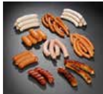
Collagendärme für Roh und Brühwürste