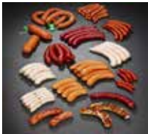
Saiten, Schweinedärme, Kranzdärme