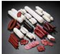
Haut und Faserdärme für Rohwürste